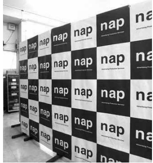
画像のものは、大きく印刷 したシートを糊付けしてつな ぎ合わせ、最終的なサイズへ 断裁しております。素材も 色々ありますが、今回は少し 光沢のある布地で試してみま した!オススメです。(帖)

今回で三度目の出店となり ましたが、産業祭ブース内に て商品販売を行うのではな く、「伝えたいをカタチに」 という会社のモットーを支え てる技術や設備のアピール・ 紹介という点に重きを置いて の出展店です。こんなものが 欲しい、ああいうのはどうや って作るのか? といった、 ご相談やご質問を沢山いただ けた事がなによりの収穫であ りました。また、社員スタッ フ一丸となり、前準備から出 店、撤収までを行えたのも、 チームワークや士気の再確認