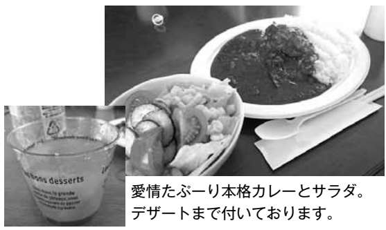
愛情たっぷり本格カレーとサラダ。 デザートまで付いております。

毎週月曜日の昼は「ミニ会 議」なのですが、第五週目は 女子部会主催となっております。 なんと今回は、手作り料理 を囲んでの「食事会・ミーテ ィング」という企画! 本当 にどれも美味しく&楽しく戴 きました。丁度誕生日のスタ ッフもいるということで、お 誕生日会も兼ねて、本当に女 子部に感謝。ありがとうございました。(賢)