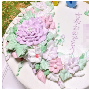
▲古希のお祝い & お名前

ハッピーバースデー、自分！という訳で、今回はお祝いケーキの話。昨年から極力外食を控えておりましたが、親族の誕生日ケーキは何か良いものをーということでご色々探していました。その中で見つけて四回もリピートしているのが、フォーゲットミー・ノット・マーマさんの、「花絞りケーキ」です。リピートの理由は、美しく楽しい。そしてちゃんと美味しいので、お祝いがとつても賑やかに！生クリームがたくさん使われていますが、甘すぎないのでペロッと食べられると思います。ご覧の皆さんにも一度は利用してみて頂きたい！ まず、注文は受取日の1週間前までに電話！お店はフレンチレストランなので、いつもケーキが置いてあるスイーツ店ではありません。花のデザインは基本お任せ！追加料金で指定の花もお願いできるらしい？メッセージやお名前が無いように！アレルギーや苦手なフルーツがある場合も事前に伝えておきましょう！