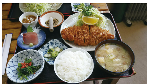
▲ローズかつ定食 950円

小鉢や刺身も充実しており、とっても満足できるランチになりました。神宮近くにお越しの際は、是非行ってみてください。