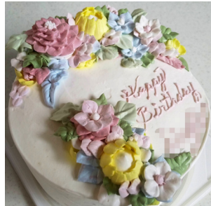
▲名前と Happy Birthday

「お店のフェイスペインスタグラムでは、過去のオーダーケーキも見られますので、参考にして頂ければ！職人技の光る、手絞りで作られる「花絞りケーキ」、お試し下さい。」