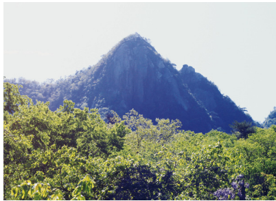
登山口から見る鉾岳。とんがってるねえ。