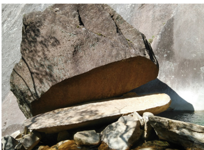
これがパッケン岩。撮影待ちの列ができるぞ。

映える写真スポットとなっております。 山頂に向かうには、川を渡り、岩をよじり、ロープを使い、梯子をのぼって、まことにアスレチック的なシーンがてんこ盛りの楽しく、苦しい山なのです。 路迷いも多く、「この道でよかったですでしょうか？」と何度も聞かれました。こちららも初めての山でしたが、そんな