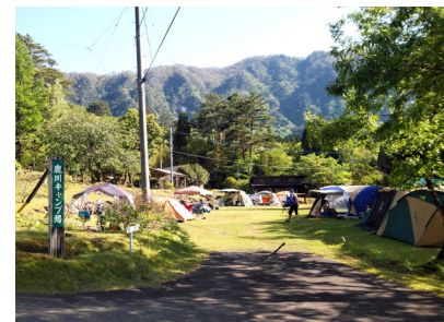
賑わうキャンプ場（延岡から約一時間）

五月の連休、人混みを避けて向かったのは、花崗岩の屹立する鉾岳（1272m）。延岡市北方の鹿川（ししがわ）地区にある、そりゃあカッコいい山です。 登山口は鹿川キャンプ場の中にあります。テントサイトは連休中なので家族連れの色とりどりのテントに埋まっています。 ロッククライミングの人気山でもあり、日本一といわれるスラブ（一枚岩）は圧巻です。この日もたくさんクライマーが壁に張り付いていました。 山頂は二つあり、それぞれ雄鉾（おんぼこ）・雌鉾（めんぼこ）と呼ばれています。また途中には有名なパッケン岩という不思議な岩があり、