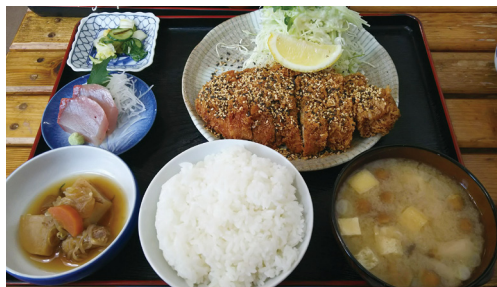
▲スパイシーかつ定食 950円

『どんかつ かつれつ軒』は宮崎神宮バス停のすぐ近くにあり、駐車場が分かりにくくて狭いので、宮崎神宮の駐車場に停めたほうが無難かもしれません。