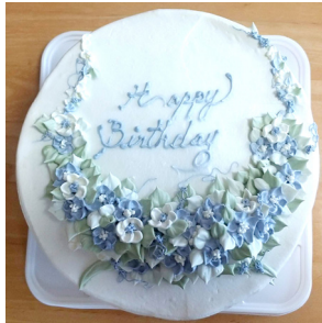
▲ Happy Birthday のみ