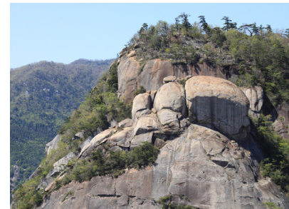
鉾岳山頂。手前の岩が雌岳。奥が雄岳。

五月の連休、人混みを避けて向かったのは、花崗岩の屹立する鉾岳（1272m）。延岡市北方の鹿川（ししがわ）地区にある、そりゃあカッコいい山です。 登山口は鹿川キャンプ場の中にあります。テントサイトは連休中なので家族連れの色とりどりのテントに埋まっています。 ロッククライミングの人気山でもあり、日本一といわれるスラブ（一枚岩）は圧巻です。この日もたくさんクライマーが壁に張り付いていました。 山頂は二つあり、それぞれ雄鉾（おんぼこ）・雌鉾（めんぼこ）と呼ばれています。また途中には有名なパッケン岩という不思議な岩があり、